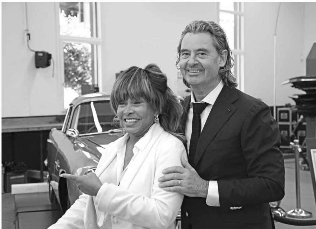
Tina Turner verstarb am 24. Mai 2023, im Alter von 83 Jahren, nach langer schwerer Krankheit in Küsnacht am