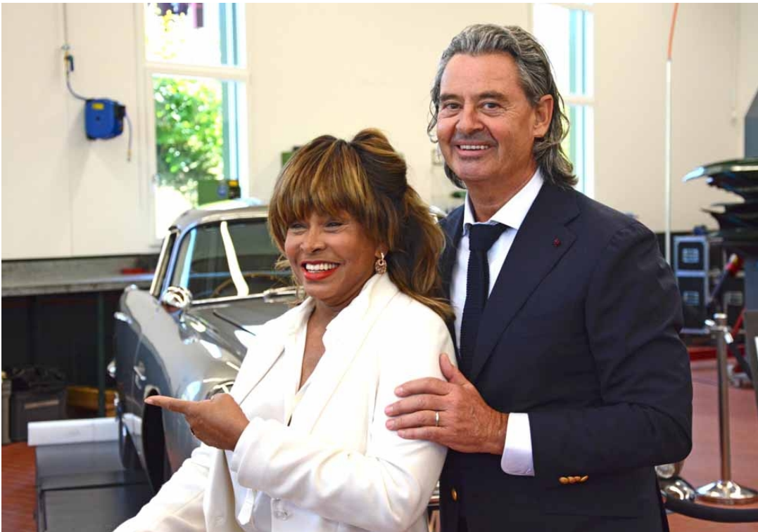
Tina Turner und ihr Partner Erwin Bach gehörten zu den Stargästen an der Eröffnung des Classic Car Centers in Safenwil.