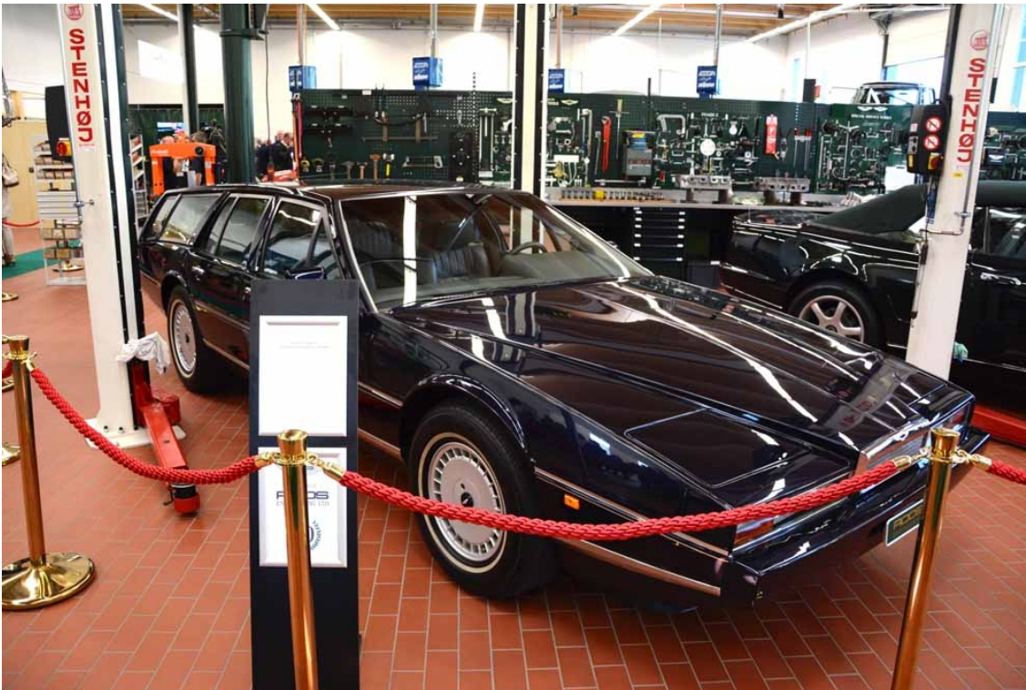
Sehr rares Automobil: Der Aston Marin Lagonda Shooting Brake.