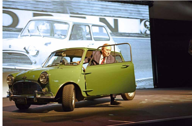
Kaum zu glauben: In solchen Minis fuhr Walter Frey einst noch selber Rennen, wie das Bild im Hintergrund zeigt.