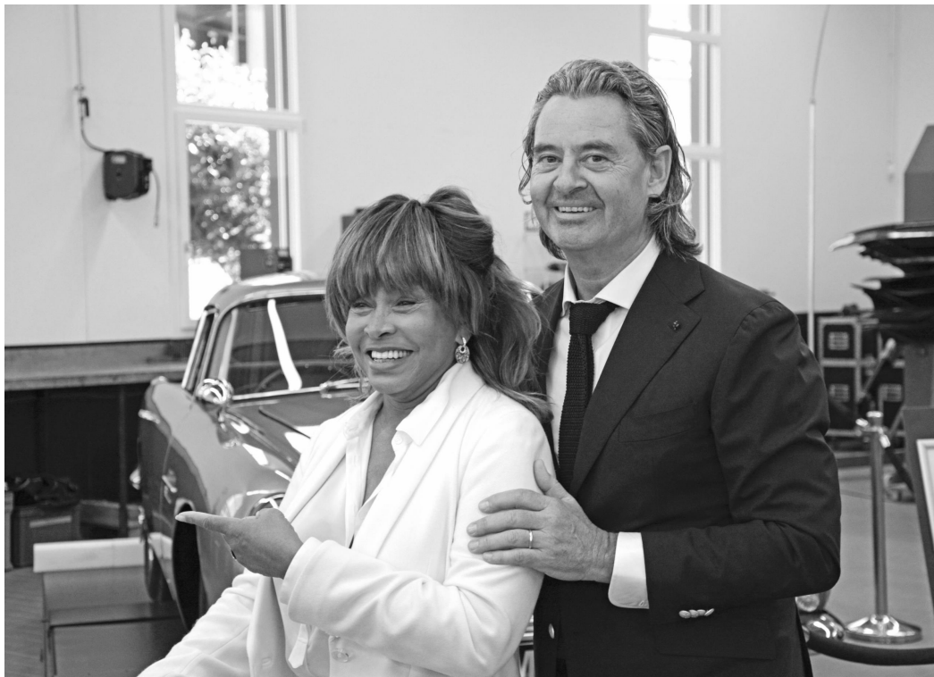
2015 in Safenwil: Weltstar Tina Turner und ihr Partner Erwin Bach anlässlich der Eröffnung des Classis Car Centers. Im Hintergrund ein Aston Martin.